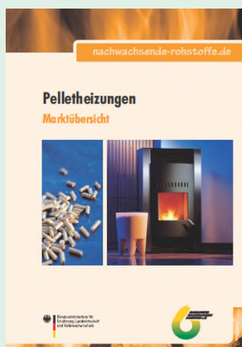
Marktübersicht Pelletheizungen, 6., aktualisierte Auflage, FNR 2010, FNR-Bestellnummer: 269

Um hier die richtige Lösung entsprechend der eigenen Bedürfnisse und Möglichkeiten zu finden, bieten sich die Marktübersichten als wertvolle Entscheidungshilfe bei der Planung einer neuen oder umzustellenden Wärmeversorgung auf Basis des nachhaltigen, nachwachsenden Rohstoffs Holz an. Die Publikationen geben einen von den Herstellern strikt unabhängigen und neutralen Überblick über die aktuelle Marktsituation und das Produktangebot.