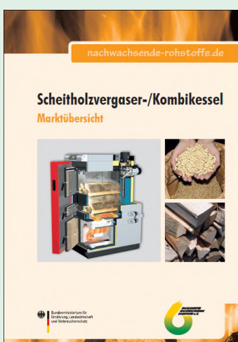
Marktübersicht Scheitholzvergaser- /Kombikessel, 3., aktualisierte Auflage, FNR 2010, FNR-Bestellnummer: 270