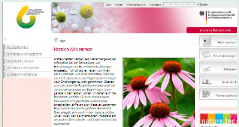
www.arznei-pflanzen.info ging im Oktober online

In Zukunft soll die Seite um einen Adressbereich ergänzt werden, der Akteure aller relevanten Bereiche wie Anbau, Forschung sowie Produktion von Pharmazeutika, Kosmetika und Nahrungsergänzungsmitteln aufführt. Auf diesem Wege soll Interessierten der Überblick über den Markt vereinfacht werden.